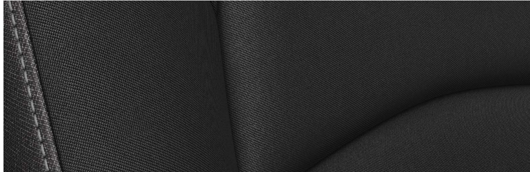
Versiones i e i Sport